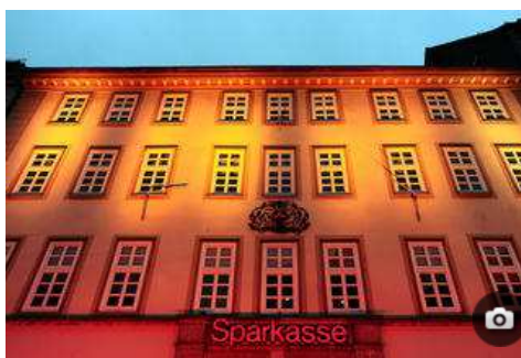
Nacht der Lichter